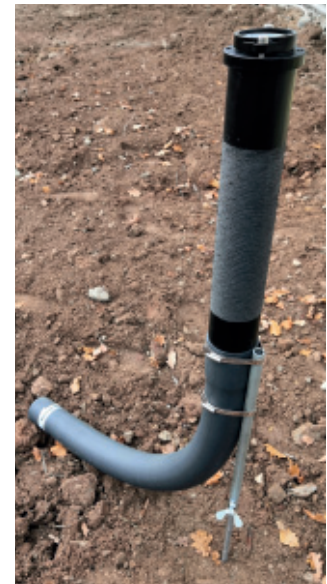
Erdspieß mit Wasserwaage positionieren und senkrecht einschlagen. Fixierung mittels der Flügelschraube M12.