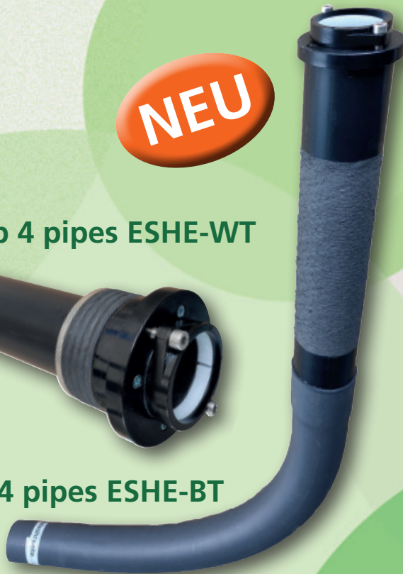
Typ 4 pipes ESHE-BT