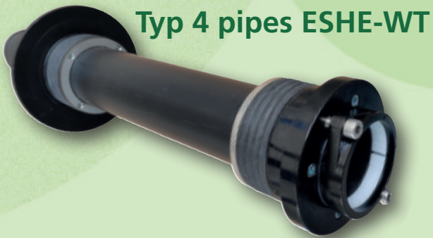
Typ 4 pipes ESHE-WT