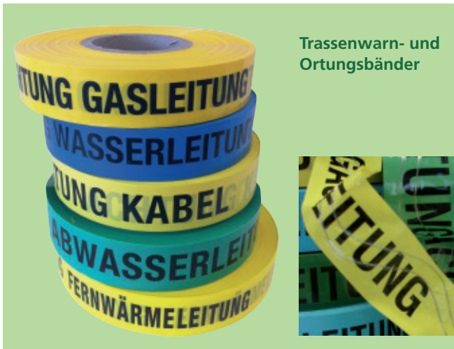
Trassenwarn- und Ortungsbänder