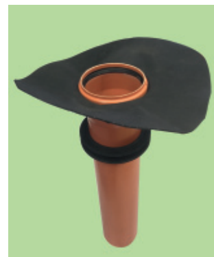
Bodendurchführung mit Klebeflansch