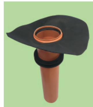
Bodendurchführung mit Klebeflansch