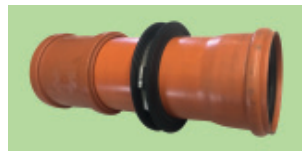
Wanddurchführung mit Doppelmuffe