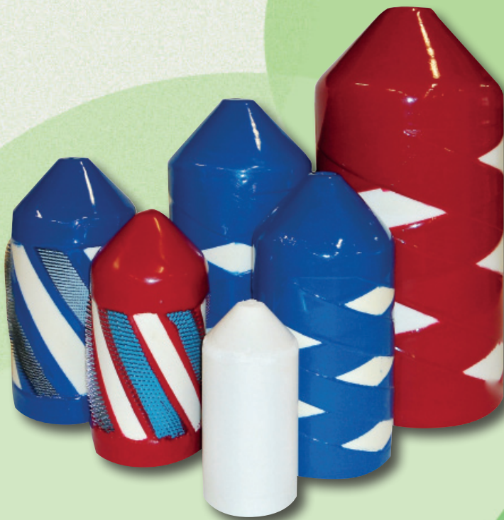
Molche 4 pipes