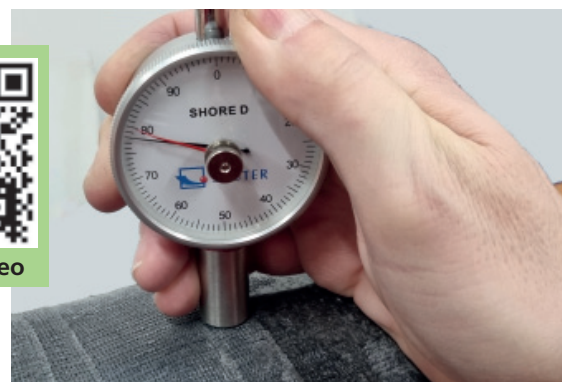
6. Kontrolle der Aushärtung nach ca. 60 min. (ca. Shore D 70°±)