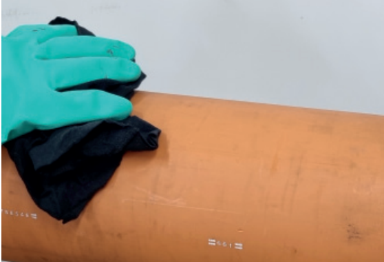
1. Oberfläche säubern, trocken entfetten

Das System wird mit Handschuhen und Klebeband zum Anpressen auf die Rohroberfläche geliefert. Eine Schutzbrille ist während der Verarbeitung zu tragen. Hautkontakt ist zu vermeiden.