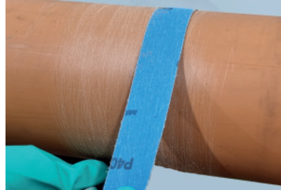
2. Oberfläche aufrauen (Bsp.: Schmirgelleinen Körnung 40-50)