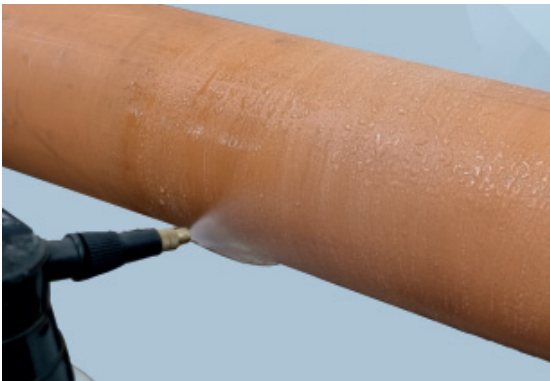
3. Rohroberfläche von Schleifrückständen befreien und anfeuchten