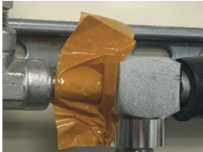
Montage „Butterfly Wrap“ Bsp.