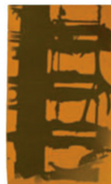
Nach Kontakt mit Wasserstoff