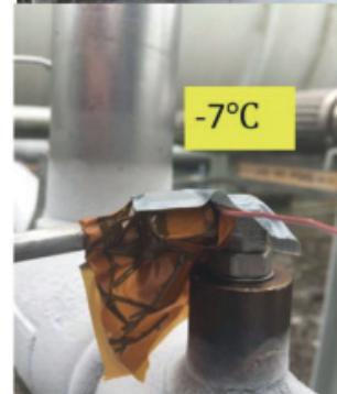
Bsp. Montage: „Gepäckanhänger“