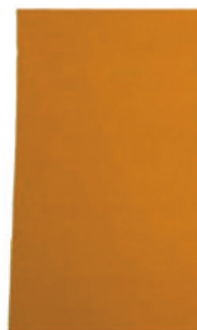
H 2 Indikator Tape vor dem Gebrauch