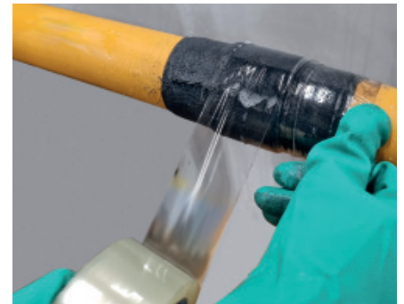
6. Mit Klebeband oder Klarsichtfolie stramm umwickeln