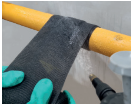
5. Pipecoat Plus mittig über das Schubsicherungsband in der geforderten Anzahl an Lagen mit 100 % Überlappung wickeln. Beim gesamten Wickelvorgang durchgehend bewässern