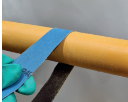
2. Oberfläche im Bereich der GFK Kufe aufrauen (Bsp.: Schmirgelleinen Körnung 40-60)