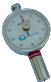
Shore D Messgerät