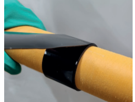
3. Rohroberfläche von Schleifrückständen befreien und Schubsicherungsband in der geforderten Anzahl an Lagen mit 100 % Überlappung wickeln