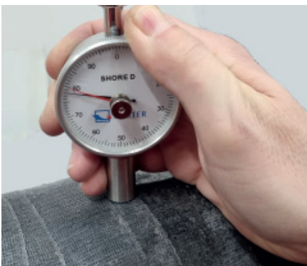
7. Kontrolle der Aushärtung nach ca. 60 min. (ca. Shore D 70 \pm )