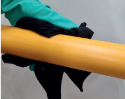
1. Oberfläche säubern, trocknen und entfetten

Das System wird mit Handschuhen und Klebeband zum Anpressen auf die Rohroberfläche geliefert. Eine Schutzbrille ist während der Verarbeitung zu tragen. Hautkontakt ist zu vermeiden.