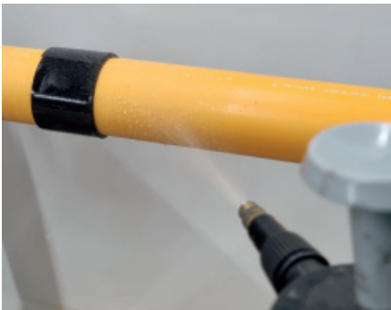
4. Oberfläche und Schubsicherungsband anfeuchten