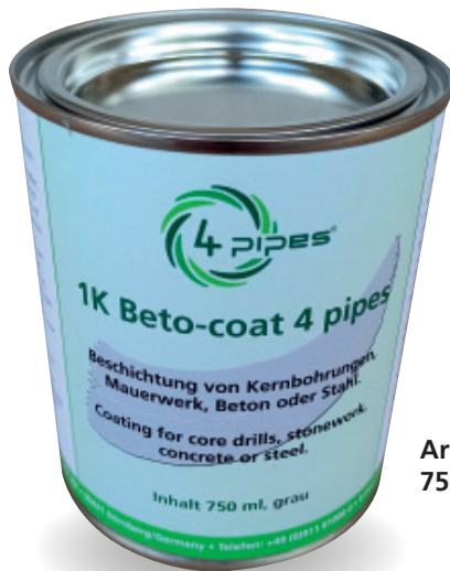
Art.-Nr. 13096 750 ml Dose