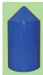
Typ PM – MV komplett PU beschichtet, Durchmesserreduzierung ca. 10%