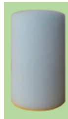
Typ PM – S mit dünner PU Bodenplatte beschichtet

Reinigung bei geringer und unbekannter Verschmutzung, Trocknen, Testlauf, Molch-Durchmesserreduzierung 50%, einsetzbar ab Bogen-Bauart 3 (1.5 d)