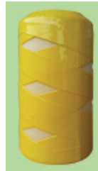
Typ PM – SX im Umfang kreuzweise PU beschichtet