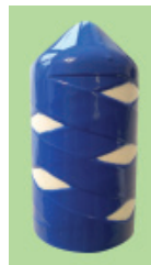
Typ PM – MX im Umfang kreuzweise PU beschichtet, Durchmesserreduzierung ca. 20%