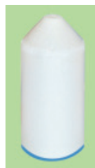
Typ PM – M PU beschichtete Bodenplatte, Durchmesserreduzierung ca. 25%

Reinigung bei mittlerer Verschmutzung, Trocknen, für lange Leitungsstrecken, für weiche Ablagerungen, für Leitungsstrecken mit vielen Formteilen, Entfernung von leichter Korrosion/ Rost, Entleeren, Trennen und Befüllen, Molch-Durchmesserreduzierung 10 - 25% möglich, einsetzbar ab Bogen-Bauart 3 (1.5 d)